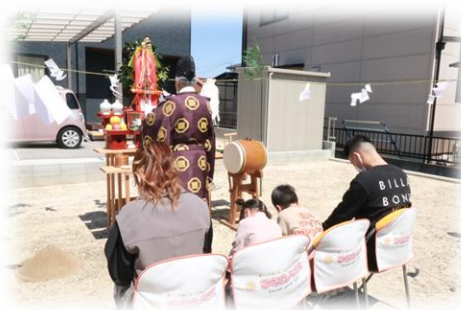
■ 地鎮祭 ■