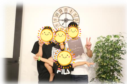
■ 契約 ■