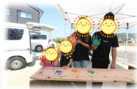
■ 手配式 ■